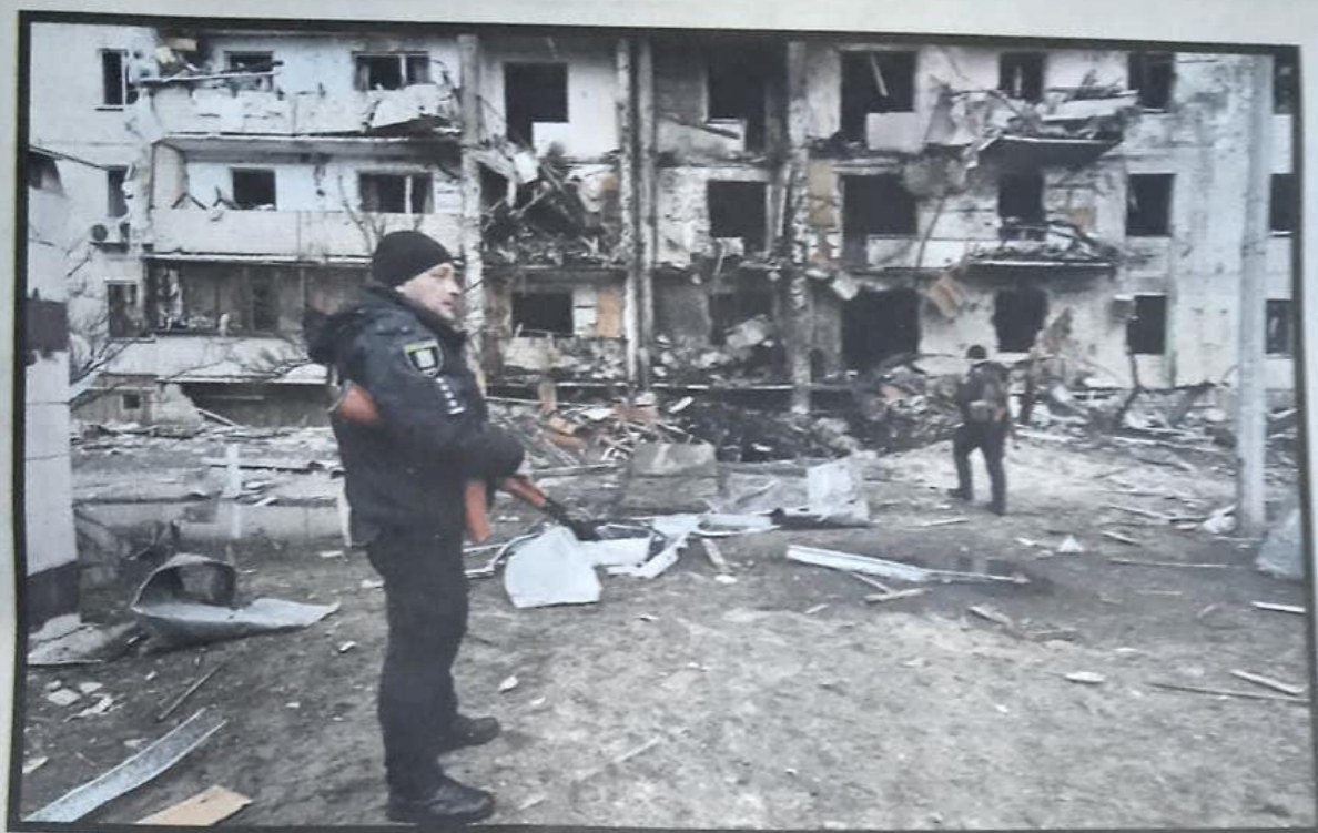
Policias frente a un edificio dañado por un proyectil ruso en un barrio de Kiev, capital de Ucrania.